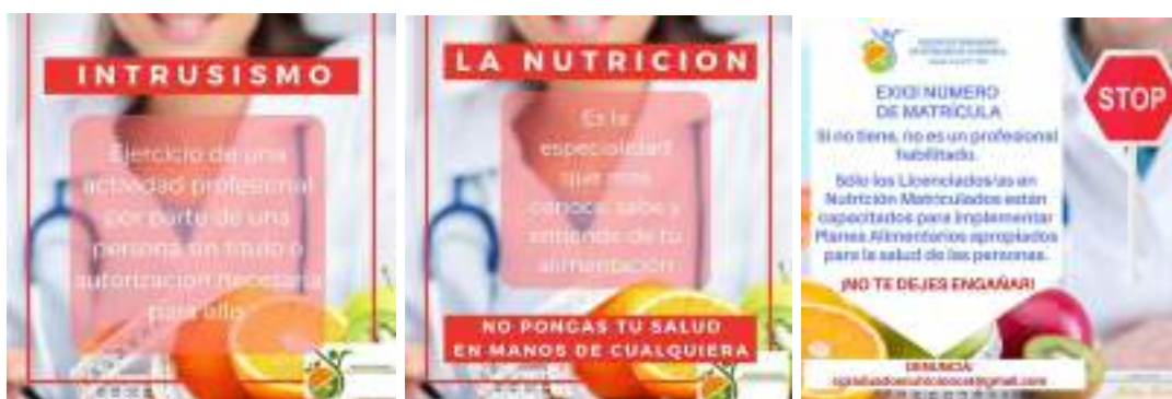
Anexo A.3: Asociación de Dietistas y Nutricionistas Dietistas de la Provincia de Chaco