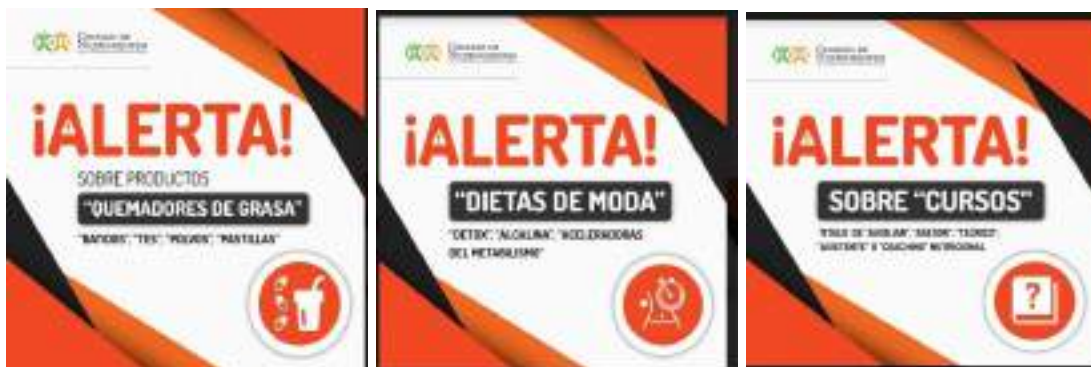
Anexo A.2: Colegio de Dietistas, Nutricionistas–Dietistas y Lic. en Nutrición de la Provincia de Catamarca