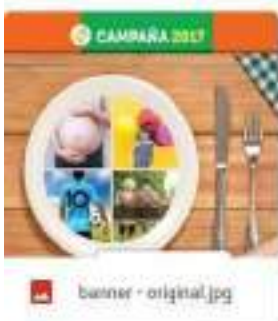
banner - original.jpg