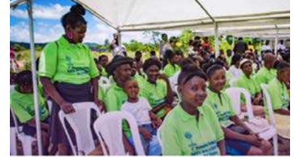
Women Resist Land Grabbing and Free Zone in Haiti

Feminist farm school faces threat from Coca-Cola monoculture.