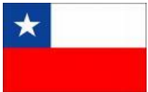
Colegio de Chile