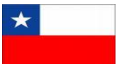
Colegio de Chile